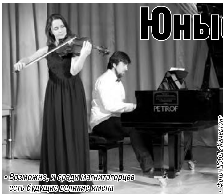
• Возможно, и среди магнитогорцев есть будущие великие имена

торы подарили воспитанникам световозвращающие элементы, выполненные в виде брелоков и значков, которые удобно крепить на верхней одежде. Кроме того, все участники праздничной программы, в том числе и группа поддержки, получили специальные подарки: развивающие настольные игры, раскраски, фломастеры и наборы для творчества.