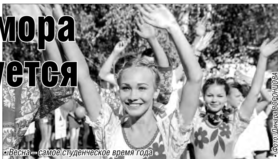
• Весна – самое студенческое время года