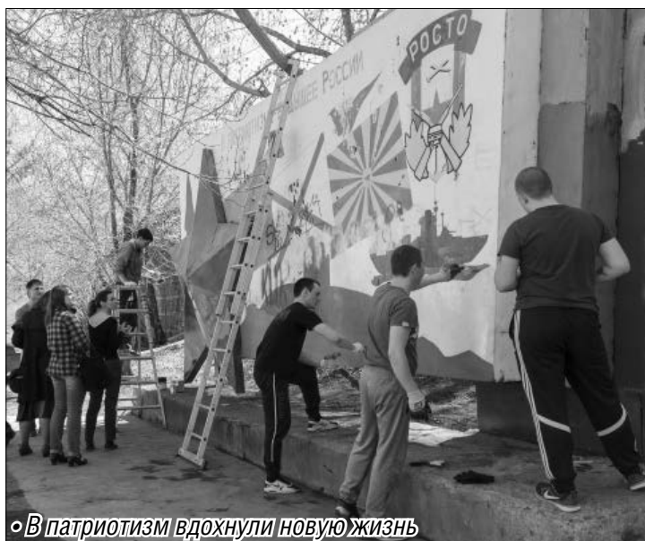
«В патриотизм вдохнули новую жизнь»

В преддверии Дня Победы прошла реставрация стелы ДОСААФ