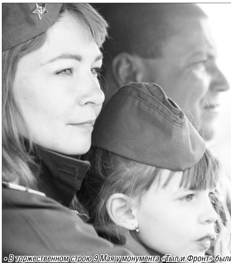
• В торжественном строю 9 Мая у монумента «Тыл и Фронт» были тысячи магнитогорцев — и первые лица города, и рядовые горожане