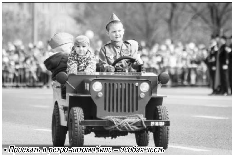
• Проехать в ретро-автомобиле — особая честь