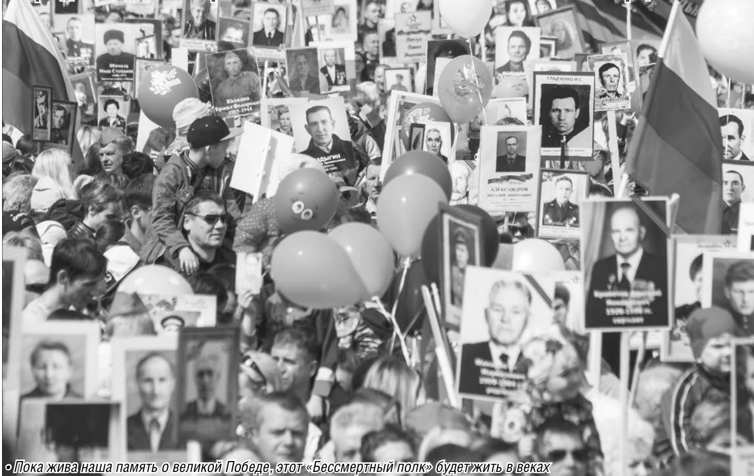
Пока жива наша память о великой Победе, этот «Бессмертный полк» будет жить в веках

Парад Победы собрал небывалое количество магнитогорцев