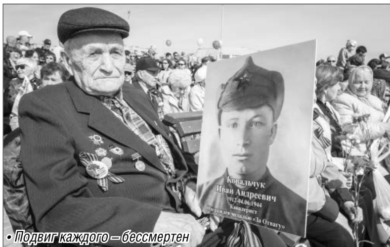
• Подвиг каждого — бессмертен