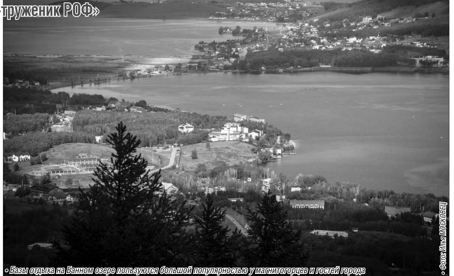
© Базы отдыха на Банном озере пользуются большой популярностью у магнитогорцев и гостей города

Поэтапно были построены котельная, клуб с вместительным зрительным и танцевальными залами, прекрасная лечебница. Не заставила себя ждать мощная система санитарно-технических сооружений с впечатляющим каскадом автоматических насосных станций, многокилометровой трассой и мощ-