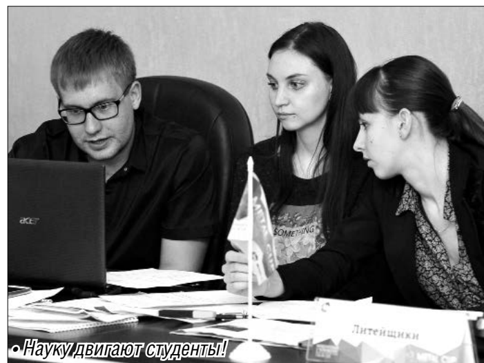
• Науку двигают студенты!