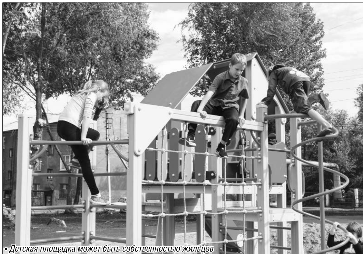
• Детская площадка может быть собственностью жильцов

Подготовила Валентина СЕРДИТОВА Продолжение следует.