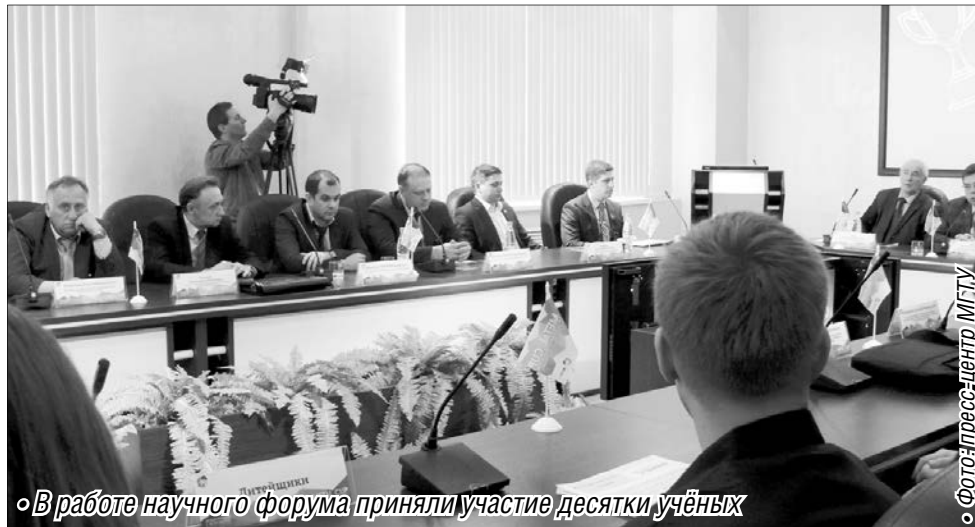
В работе научного форума приняли участие десятки учёных

На базе МГТУ прошла VIII Международная научная конференция