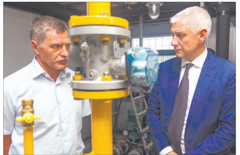
С первыми холодами заработают новые котельные

– Прежде всего это социальный объект. Сегодня город планомерно занимается левобережьем. Левый берег – это шикарный район, при должном внимании он может быть не менее престижным, чем берег правый, и должен пользоваться не меньшим режимом благоприятствования, чем другие территории. Что касается сегодняшнего события: организация выводит из эксплуатации устаревшее неэффективное оборудование, а на смену ему запускают сразу две котельные. Это суперсовременное производство, котлы будут работать в автономном режиме, на удаленном доступе. Вся информация поступает на пульт управления, и в автоматическом режиме будут приниматься