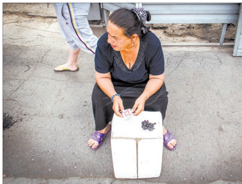
Встретили мошенника – проходите мимо

С начала года в городе зарегистрировано около 350 случаев мошенничества