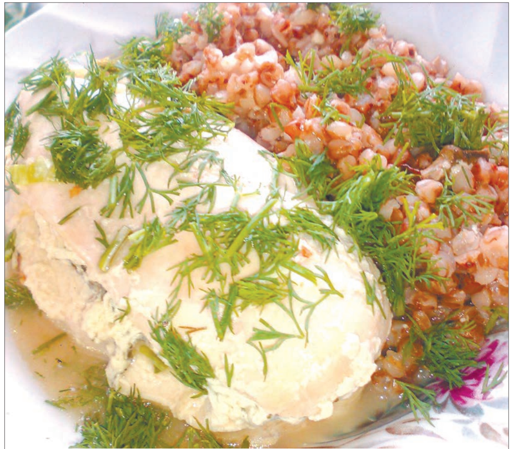
Самая обычная гречка с курицей может стать вкусным «сундуком с кладом»

четыре филе куриной грудки, ломтики любого сыра,