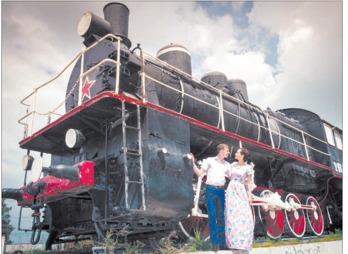
Паровоз – визитная карточка Магнитки и её железных дорог