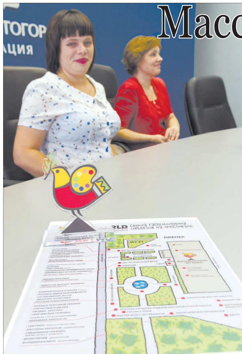
К кому прилетит символ фестиваля?

4 и 5 августа в Магнитогорске пройдет фестиваль «ARTWORD – мир искусства».