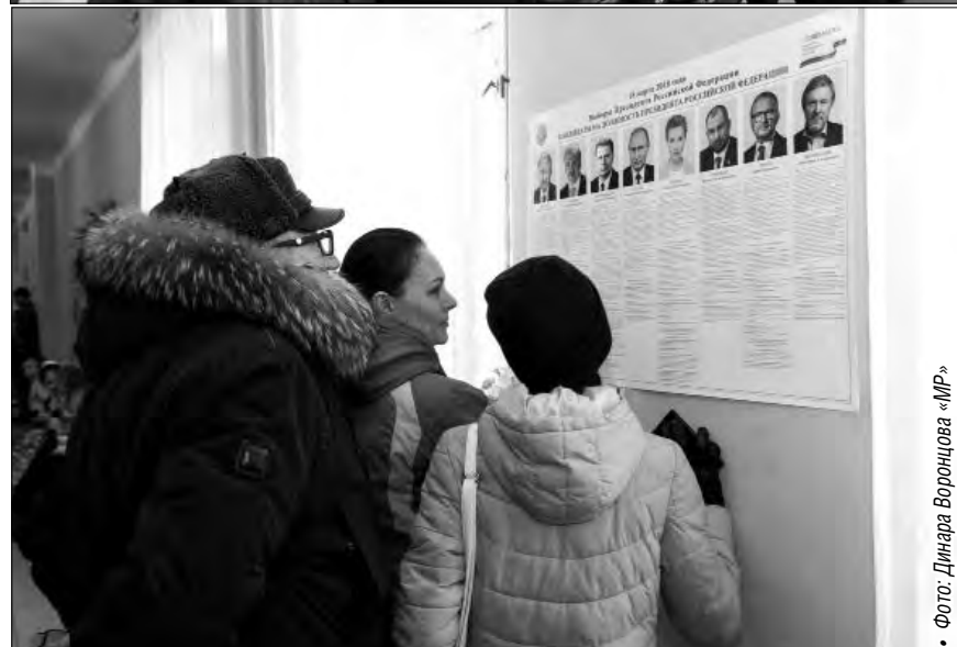
• Фото: Динара Воронцова «МР»