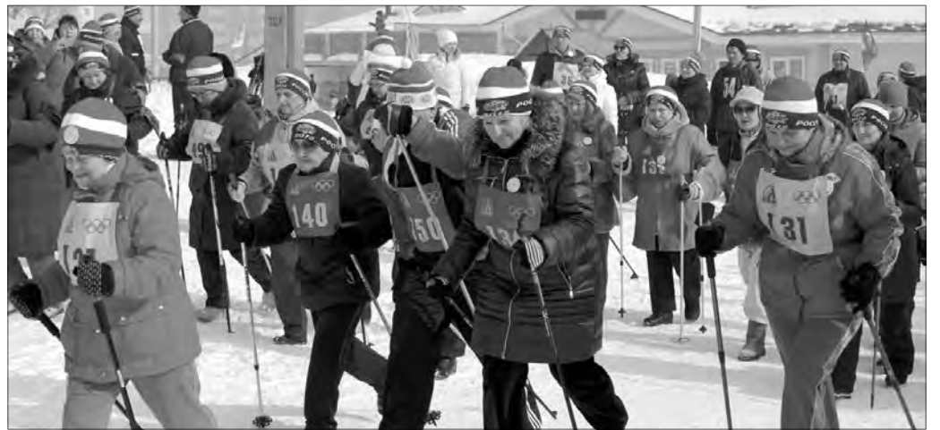
Число любителей скандинавской ходьбы растёт год от года