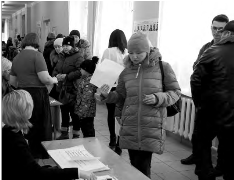
Магнитогорцы продемонстрировали высокую активность

Эксперты отмечают, что сплоченности и консолидации большинства, поддерживающего Владимира Путина, в Челябинской области способствовала работа, которую провела коман-