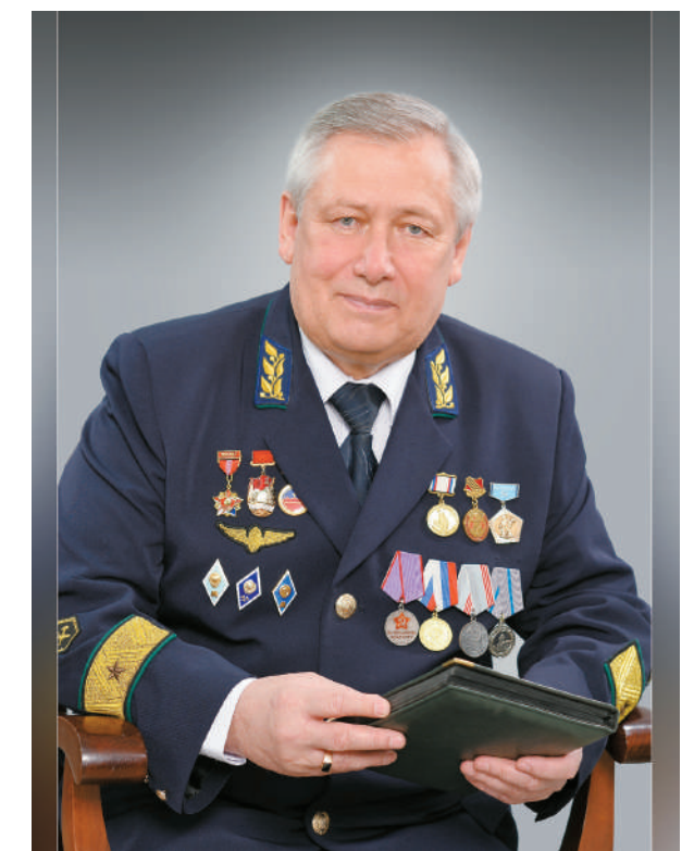
Поздравляю ветеранов Магнитки, всех горожан с 54 годовщиной ветеранского движения. Желаю крепкого здоровья, бодрости, долголетия и неутомимой работы на благо нашего родного города!