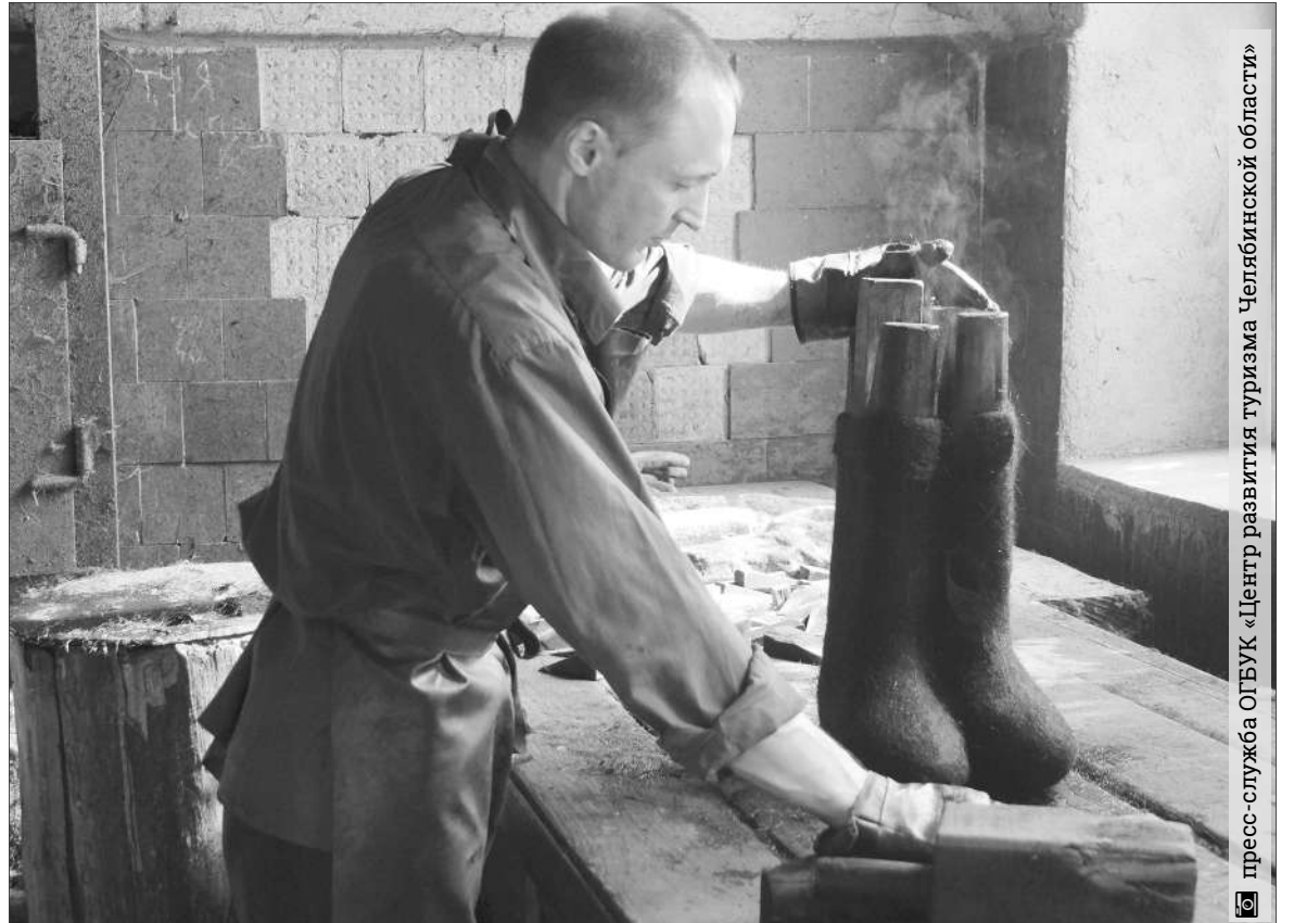
пресс-служба ОГБУК «Центр развития туризма Челябинской области»

С 4 октября Челябинская область перейдет на формат цифрового телевизионного вещания – это отсутствие абонентской платы за основные каналы. Цифровой сигнал доступен вне зависимости от удаленности и размера населенного пункта. Достаточно приобрести антенну дециметрового диапазона. При этом большинство совре-