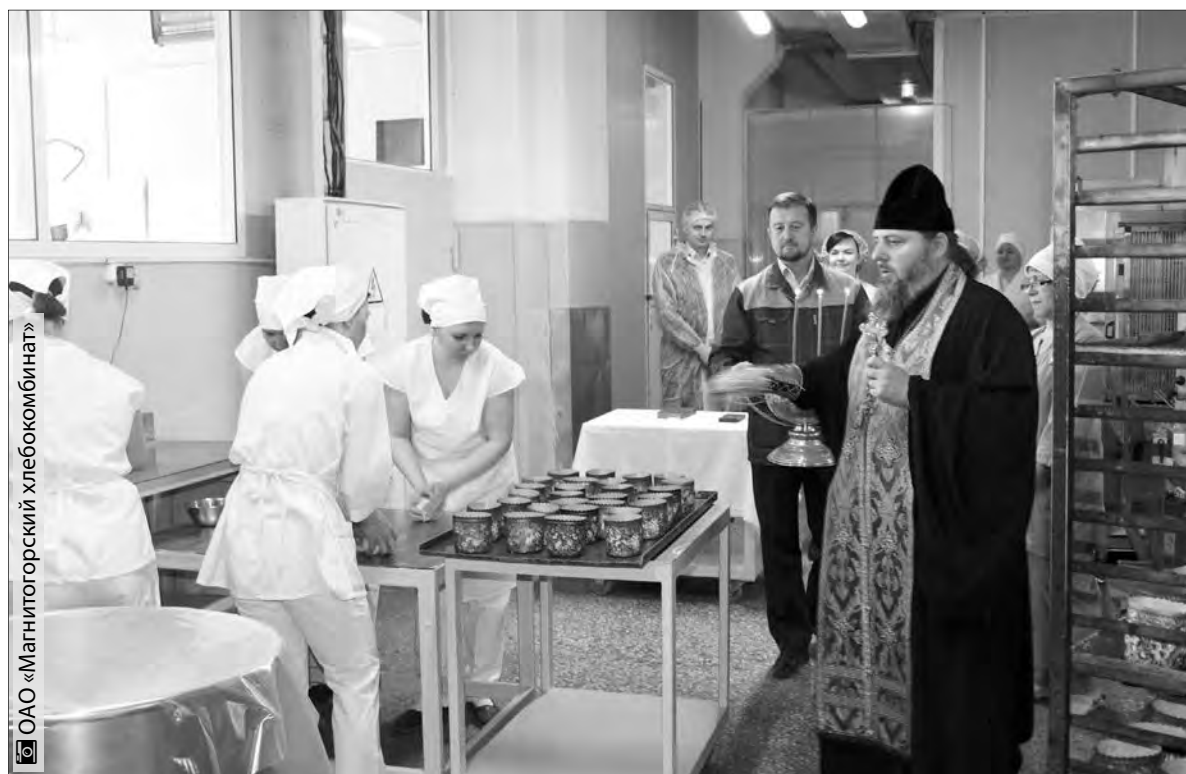
ОАО «Магнитогорский хлебокомбинат»

Магнитогорский хлебокомбинат подготовился к светлому празднику Пасхи