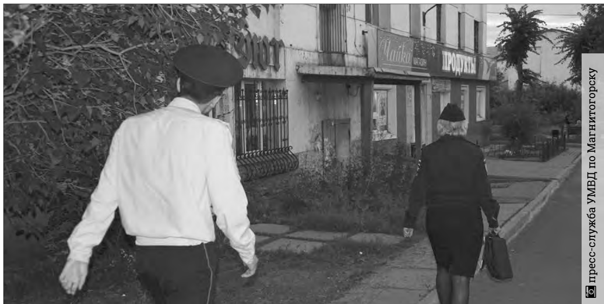
Правоохранители проверили подопечных и поставили на учёт новые семьи

ции. — Мы отвечаем, что можем навещать и в новогоднюю ночь.