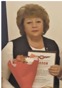
Наталья Чинякова / фото: Личный архив

Муниципальное учреждение «Реабилитационный центр для людей с ограниченными возможностями здоровья» Магнитогорска стало победителем областного конкурса