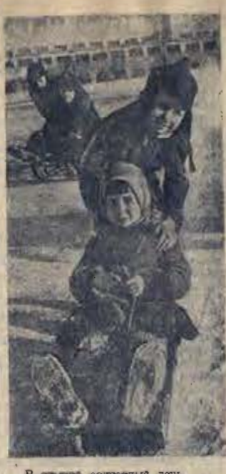
В осенней солнечной тени.

Варан № 1 по улице Труда (5-й участок) плохо благоустроена. Площадка перед школой не асфальтирована, нет скамеек, не вычищены лотки. Двор перед школой не вычищен, там же играют дети. В зимнее время там же играют дети. В зимнее время там же играют дети. Улицу, прилегающую к школе, необходимо очистить от снега, вычистить лотки, вычистить двор перед школой. Может ли такая школа дать хорошее образование детям? ПРЕПОДАВАТЕЛЬ.