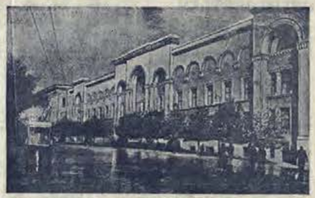
По городам Советского Союза. На снимке: админ. музей Грузии в городе Руставели в Тбилиси.

МОСКВА, 21 декабря. 25 декабря в Москве открылся пятнадцатый трехмесячный курс руководящих работников легкой промышленности.