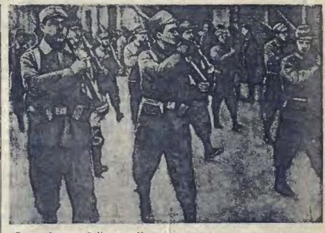
В республиканской Испании. На снимке: бойцы республиканской армии прорывают линию Таррагона перед отступающей армией Франко.

В течение второй половины дня фашистская авиация четыре раза возобновила попытки бомбардировать Таррагону, но республиканские самолеты каждый раз отменяли фашистских самолетов.