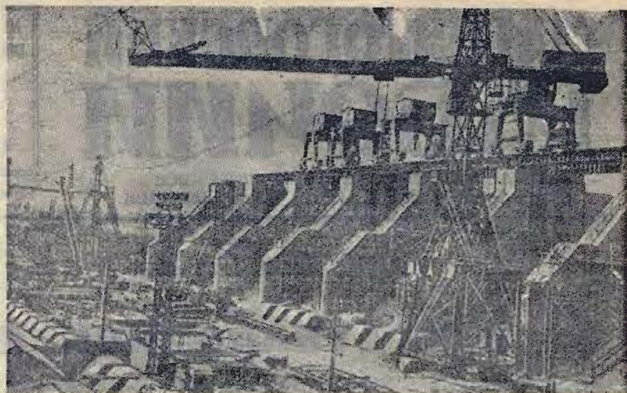
На строительстве Горьковской гидроэлектростанции. Сооружение водосливной плотины.

ЦЕНТРАЛЬНЫЙ КОМИТЕТ КОММУНИСТИЧЕСКОЙ ПАРТИИ СОВЕТСКОГО СОЮЗА.