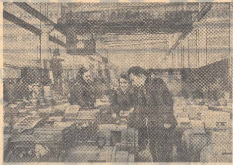
Ленинград. Машины с марной ленинградского завода «Электрик» используются большим спросом во многих странах мира. В первом квартале текущего года заказчиками завода являются представители 15 различных государств.

СТАЛИНГРАД (ТАСС). Завершено создание государственной лесной защитной полосы Пенза-Каменск. Она состоит из трех лент шириной по 60 метров, расположенных в 300 метрах друг от друга. Полоса проходит через Пензенскую, Саратовскую, Сталинградскую и Ростовскую области.