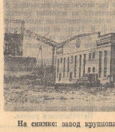
На снимке: завод крупнопанельного домостроения.