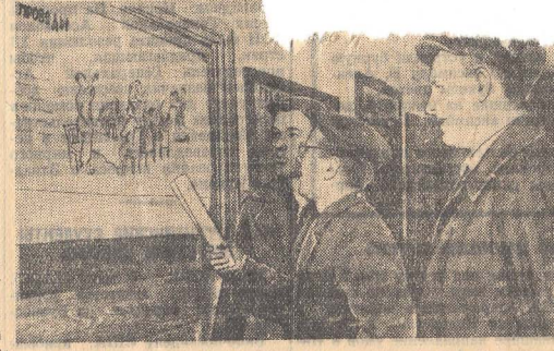
Большой популярностью пользуются среди работников доменной цеха сатирические листовки «Крокодил». На снимке: трудящиеся цеха у очередного «Крокодила».

Рассказ деда Решил я внуку В день рождения Такую вещь Кудить. Чтоб не терять к ней Уваженья Покуда будет Жить. Решил... Хожу по магазинам — Нет время Покупить. Ищу подарок К именинам. Для внука. Стало быть. Купил Серебряную ложку Ему В честь именин. Отныне Мяту картошку Пусть ест. Как господин! Домой я В аккурат к обеду С подарком Угодил. И перед внуком Ложку эту На стол Я положил. Лежит она, Как королева... Так я Глядел-глядел И думаю, Что вот без хлеба Сейчас бы Ложкой ел. Но я же внуку Эту радость Серебряную Взял... А внук скользнул По ложке взглядом И съел Кусочек стал! Подел раз десять Именинник — Бряк. Серебро на стол. Берет свой прежний Алюминий И дальше Есть пошел. — Ты что же, Недоволен мною? — Дедуся, Не сердись. А только ложкою Такою Ты лучше сам Трудись. Удешный вес Неподходящий, Есо ложку Отмотал... — Сказал. И алюминий в ящик Любвяно Прятать стал. Силу я, значит, Туча-тучей И размышляю Тут Чему их только В школе учат, Коль серебро Не чуют?