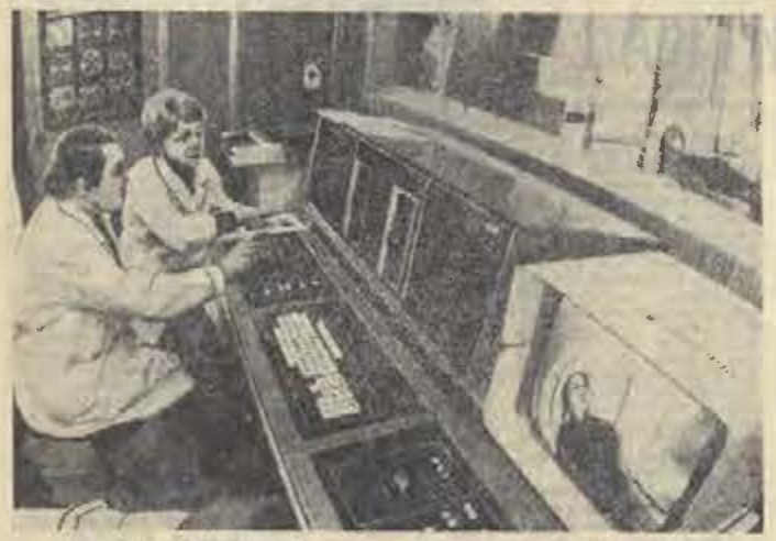
НА СНИМКАХ: ульва компьютерного томографа производства французской фирмы «Томсон-ЦСФ» — принципально нового метода диагностики, в котором объединены возможности современной рентгеновской техники и элек- тропо-вычислительных машин.