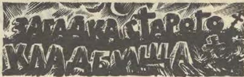
(Продолжение. Начало в № 52—57).